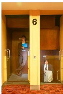
Poppen in de paternosterlift van het Vlaams Parlement

Daarna liepen we door naar de koepelzaal. We zagen eerst het glazen dak vanaf boven. Daarna zagen we de onderkant van de koepelzaal: een soort ingegoten schelp. Toen gingen we in de koepelzaal, die was kleiner dan ik had verwacht maar wel mooi. Deze keer zag je het glazen dak heel mooi. Toen gingen we weg naar een andere ruimte en daar gaf de gids wat uitleg over het stemrecht in het verleden. Blijkbaar mochten vrouwen nog niet zo heel lang geleden niet stemmen. De rondleiding was bijna gedaan.