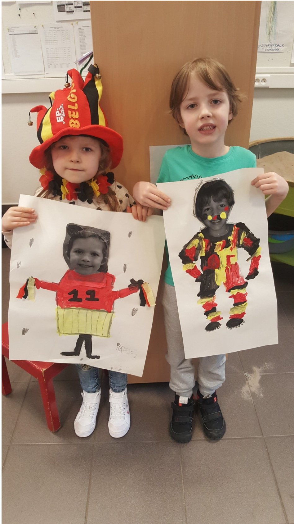
Fantastische supporters !!!!!