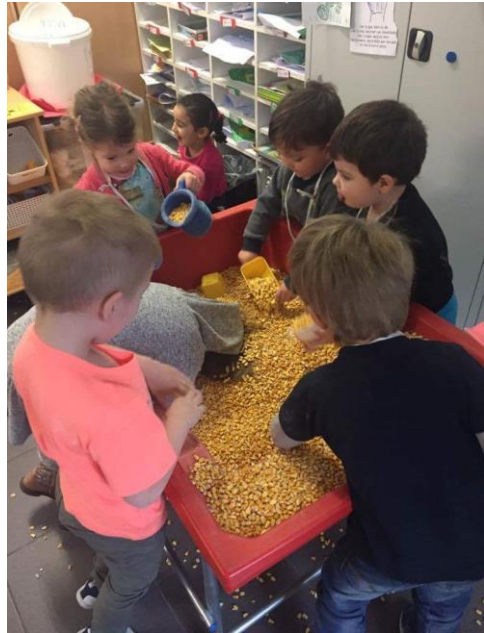
Spelen met maïs